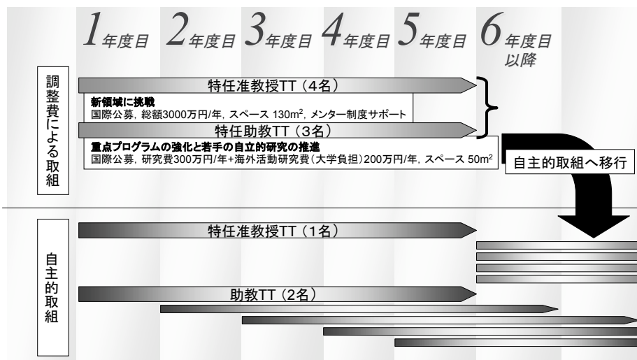
図1. 金沢大学におけるテニユア・トラック制度