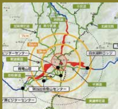
白山の噴火シナリオ