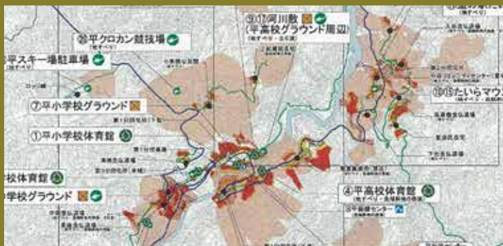
平村地区ハザードマップ